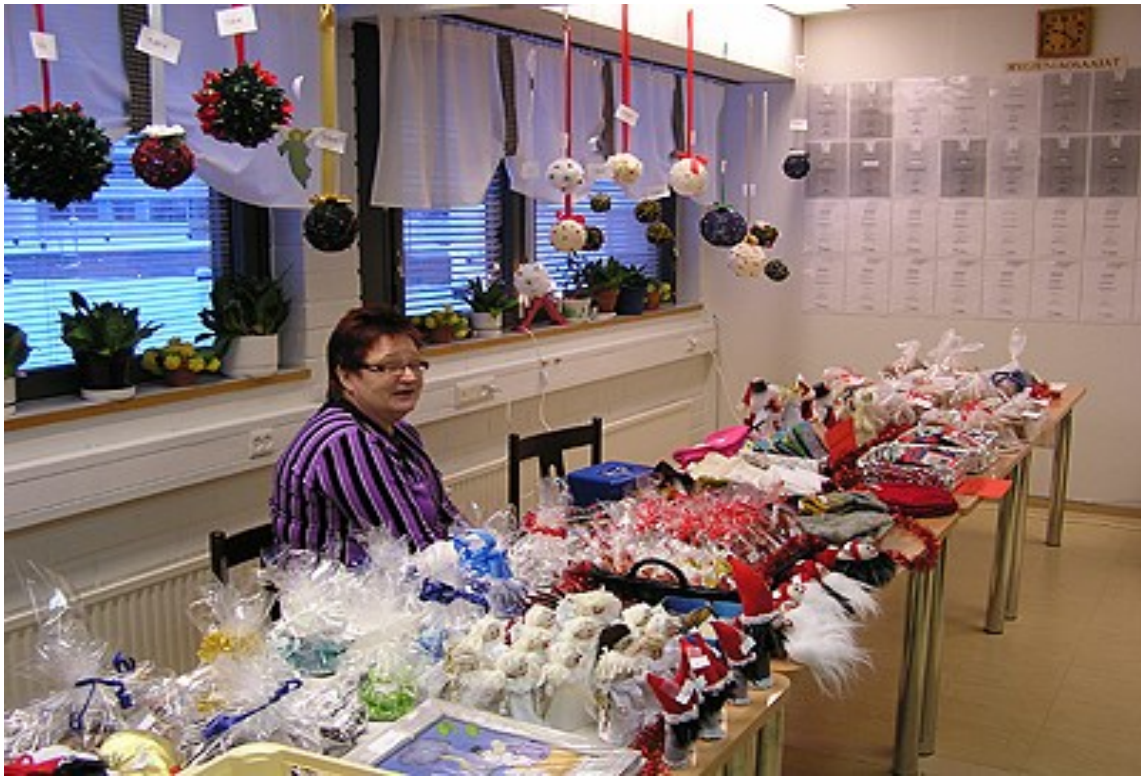
Raili ja myyjäispöytä. Asiakkaita odotellaan ,koska tavaraa on rutosti tarjolla. Tavara on itse tehtyä ja muualta saatua. Katossa roikkuu Klubitalon omat keksinnöt; joulupallot.