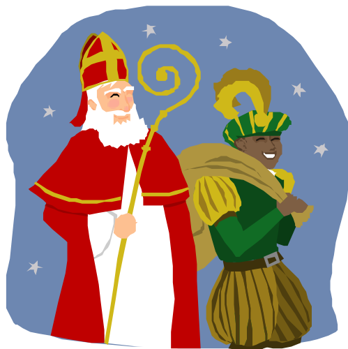
Sinterklaas ja Zwarte Piet (Musta Pekka)

Englantilainen joulun henkilöitymä on Father Christmas, joka aiemmin pukeutui vihreään eikä tuonut lahjoja. Amerikassa hän sulautui yhteen Sinterklaasin kanssa. Vuonna 1823 ilmestynyt runo ”The Night before Christmas” vakiinnutti monia käsityksiä Santa Clausista. Pilapiirtäjä Thomas Nast teki 1863 hänestä parrakkaan, lihavan ja punapukuisen ja levitti käsitystä jonka mukaan hän asui pohjoisnavalla. Haddon Sundblom, jonka isä oli Ahvenanmaalta, maalasi 1930-luvulla Coca-Colan maineikkaat joulupukkimainokset, jotka ovat määrittäneet joulupukin nykyisen asun ja ulkomuodon.